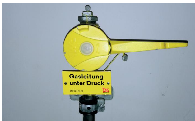
Verzapfte Hausanschlussleitung im Haus

Der Gasanschluss wird unmittelbar beim Gebäudeeintritt nach dem Hauptabsperrventil verzapft und mit einem Warnhinweis versehen. In regelmässigen Abständen überprüft Thurplus die Verzapfung, um Sicherheitsmängel rechtzeitig zu erkennen.